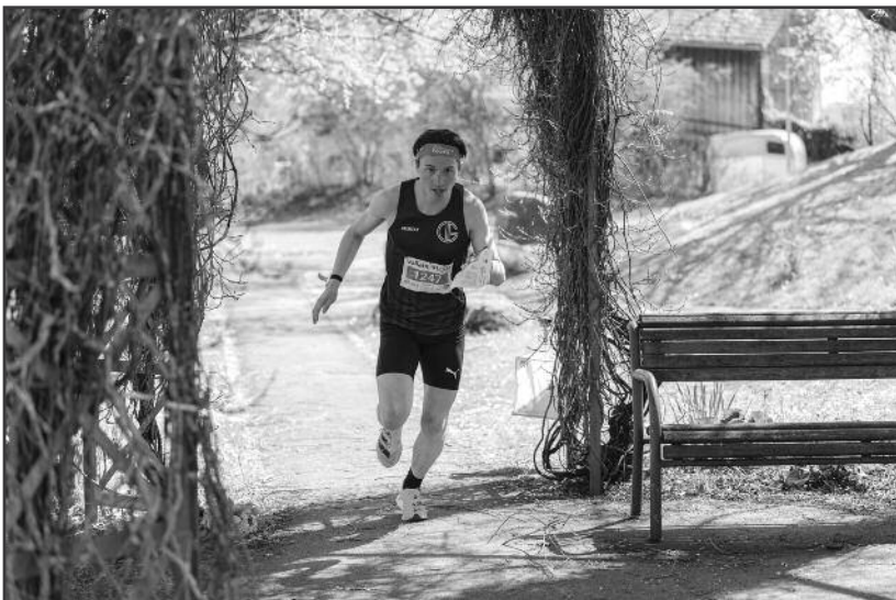
Auf den kurzen Strecken mussten sich die Läufer möglichst rasch orientieren, um die zahlreichen Posten anzulaufen. mon

Genauere Informationen, sämtliche Karten und Ranglisten finden sich unter: ol.bremgarten.be