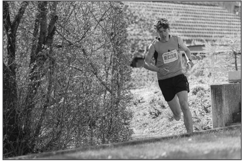
Der Knock-Out Sprint führte teilweise auch über privates Gelände. mon

«Weltmeister von heute organisieren für die Weltmeister von morgen»