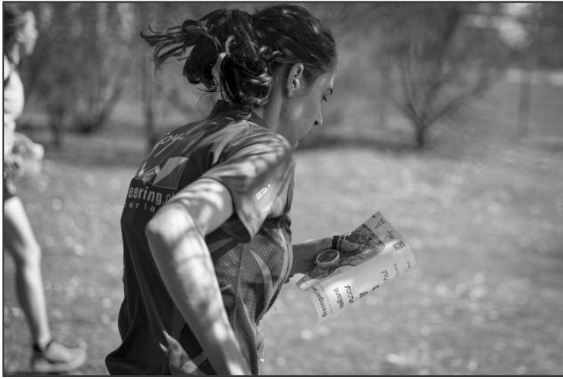
Schnelligkeit und Köpfchen. Erschwerend gegenüber anderen Laufsportarten setzt der OL schnelles Kartenlesen und gutes Vorstellungsvermögen voraus. mon