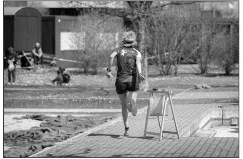
Besonders auf dem Sport- und Spielplatz liess es sich mitfiebern. Der Parcours führte die Teilnehmenden kreuz und quer über die Flächen, die kurz vor dem Ziel-einlauf so richtig Gas gaben.